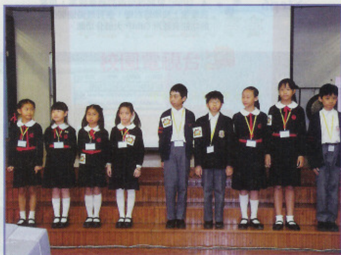
▲ 校園電視台的一眾「員工」