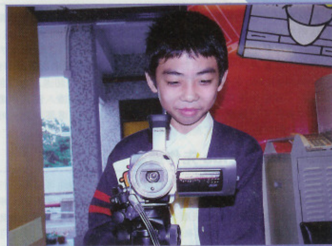
▲ 攝影師工作時不期然流露着自信的笑容。