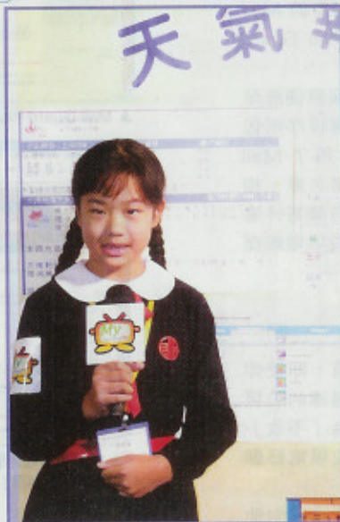
▲ 操流利英語的天氣報告小姐

校園電視台原本是用蘋果電腦 iMac 運作的，但由於學校的 PC 始終較多，另外也由於每部 Windows XP 電腦也附送了 Movie Maker，毋須花錢再買軟件，所以為達到善用資源的目的，學校最終決定以 VCAST 及微軟合作提供的校園電視網播站方案組合，以 Microsoft Windows 2003 Server 及 VCAST 提供的串流伺服器等硬件支持校園電視台及其他網上應用。VCAST 是一家數碼互動廣播供應商，曾為本港 97 回歸、中國國慶 50 周年、香港千禧倒數等提供網上廣播，現在也為學校提供校園電視網播站的整合服務，價錢由 $8,000 至 $60,000 多不等。