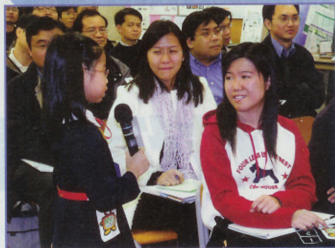
▲ 校園小记者即席訪問在場觀眾。