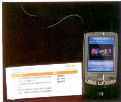
▲ 校園任何角落均可收看網上影片及多媒體內容。

真正達至全方位的教學模式，同學間亦能透過不同的小組研習，加強溝通，互補不足。My Campus TV的無線網絡，配合VCAST流動串流編碼系統，實現校園任何角落都可直播或點播網上影片及多媒體內容。