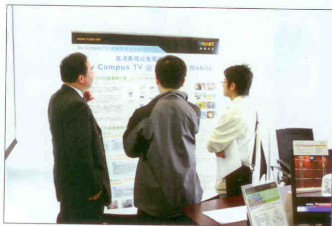
▲ 與會者都對My Campus TV校園電視方案深感興趣。

My Campus TV校園電視方案的示範人員，首先讓參觀者理解到「隨著科技發展，學習再不只是在課室內進行。」的理論及好處，並提出跳出課室框框，才可拓寬學習時空，不再受時間、地域以至空間的局限，也可容易讓學生投入學習樂趣，透過跨學科的協作課程，延伸及深化所學。接下來，示範人員逐一利用不同媒體，包括TV、PC及手機，示範My Campus TV校園電視方案的好處。