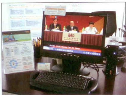
▲ 校園電視可播放及多媒體即時新聞。

現時學校於大堂、雨天操場、教員室多安裝有影音器材，若善加利用，播放多媒體即時資訊或RSS訊息（如新聞、天氣等），不單讓學生可更快的知道學校的最新消息及學校活動內容，亦是老師與家長溝通的最佳途徑。My Campus TV其中一個賣